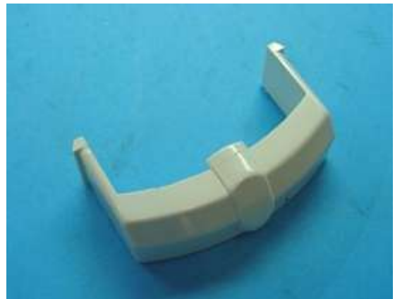
Κάλυμμα διακόπτη φωτός

Τα ανταλλακτικά είναι διαθέσιμα από την τεχνική υπηρεσία της PETCO ΑΕ.