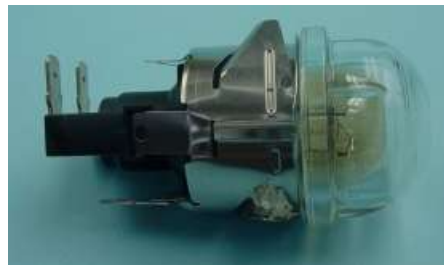
Σετ λαμπτήρα, με φως και κάλυμμα

Τα ανταλλακτικά είναι διαθέσιμα από την τεχνική υπηρεσία της PETCO ΑΕ.